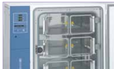
氣密八小內門設計