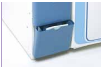
前方口袋式儲存空間，可存放紀錄表