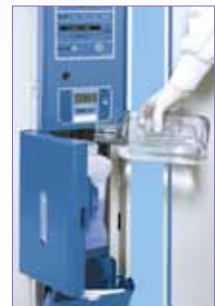
外置潮溼瓶，方便加水