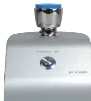
WaterVac 100 - MS (190110-01/02)