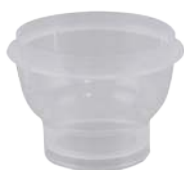
Sartorius, 100 ml / 250 ml Microsart® 拋棄式過濾杯 (16A07--10-----N/ 16A07--25-----N)