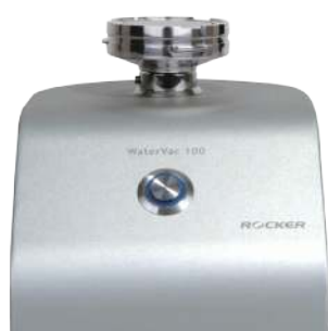
WaterVac 100-MB (190120-01/02)