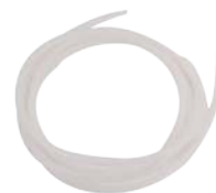
矽膠管 Ø 4.2 x 8 mm, 200 cm (199100-68)