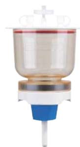
Rocker, 300 ml MF 3, 磁式過濾漏斗 (200300-01)