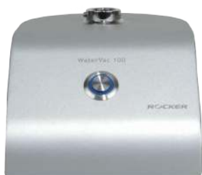
WaterVac 100 (190100-01/02)