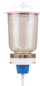
Rocker, 500 ml MF 5, 磁式過濾漏斗 (200500-01)