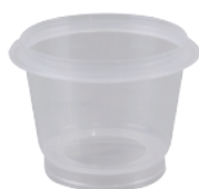
Millipore, 100 ml / 250 ml Microfil® 拋棄式過濾杯 (MIHAWG100 / MIHAWG250)