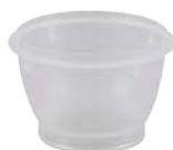
Pall, 100 ml / 250 ml Sentino® 拋棄式過濾杯 (4870/4871)