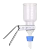
Rocker, 300ml VF 6 玻璃過濾漏斗 (167120-31)