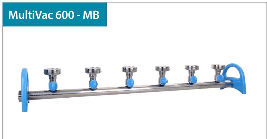
MultiVac 600 - MB