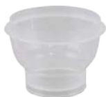
Sartorius, 100 ml / 250 ml Microsart® 拋棄式過濾杯 (16A07-10-----N/ 16A07-25-----N)