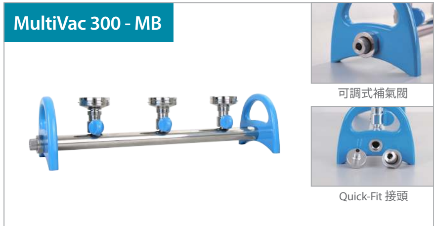
MultiVac 300 - MB