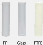
PP Glass PTFE